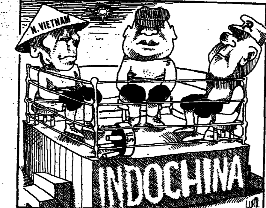
حلبة الهند الصينية : فيتنام على الشمال ، والصين ، والاتحاد السوفياتي على اليمين ، والولايات المتحدة على اليمين .